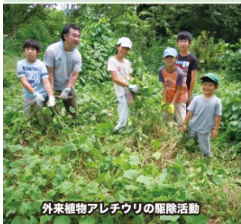
外来植物アレチウリの駆除活動