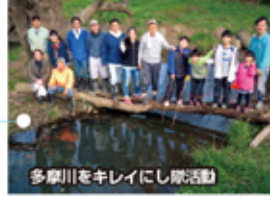
多摩川をキレイにし隊活動