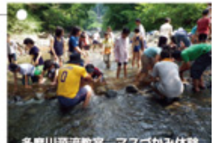
多摩川清流教室—マズガみ体験