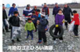
河原のゴミひろい清掃