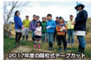
2017年度の開校式テープカット