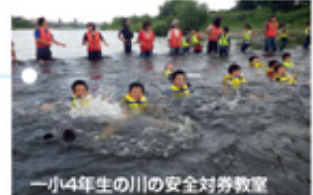
一小4年生の川の安全対策教室