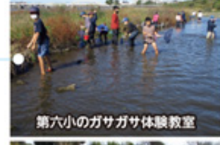
第六小のガサガサ体験教室