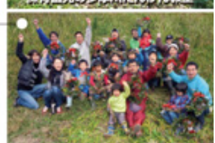
トロロも欲しがX'masリースづくり