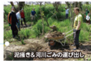
泥掻き&河川ごみの運び出し