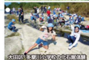
大田区・多摩川小学校の化石掘り体験