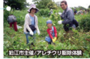
粕江市主催/アレチウリ駆除体験