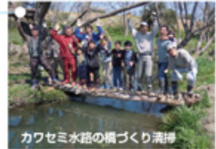
カワセミ水路の橋づくり清掃