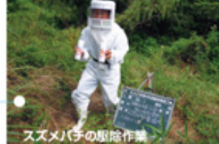
スズメバチの駆除作業