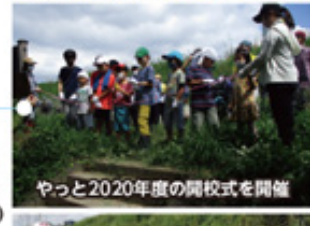
やっと2020年度の開校式を開催