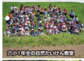
六小1年生の自然たいけん教室