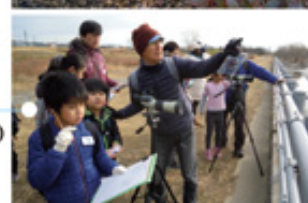
粕江市主催/冬の生きもの調査会