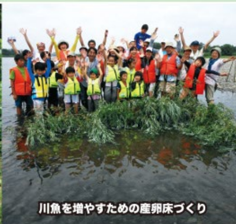
川魚を増やすための産卵床づくり