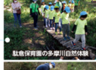
駐倉保育園の多摩川自然体験