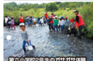
第六小学校2年生のガサガサ体験