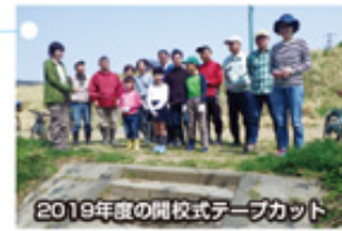
2019年度の開校式テープカット