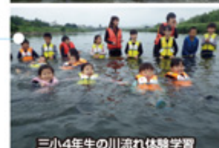
三小4年生の川流れ体験学習