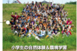
小学生の自然体験&環境学習