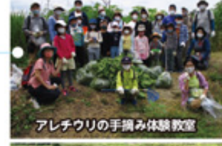
アレチウリの手摘み体験教室