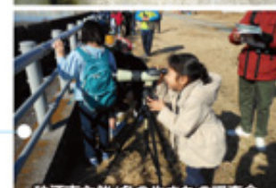
狛江市主催/冬の生きもの調査会