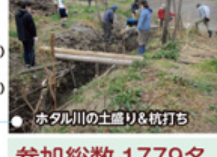
ホタル川の土盛り&杭打ち