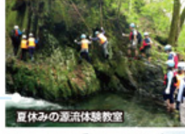
夏休みの源流体験教室