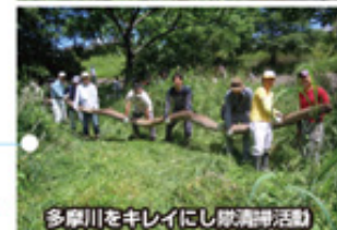
多摩川をキレイにし隊清掃活動