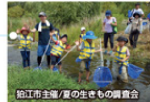
狛江市主催/夏の生きもの調査会