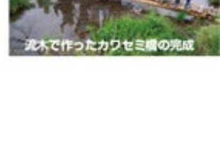
六小4年生の多摩川学習