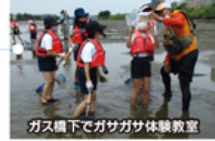
ガス橋下でガサガサ体験教室