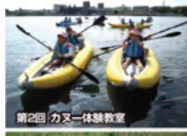
第2回カヌー体験教室