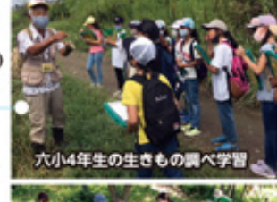
六小4年生の生きもの調べ学習