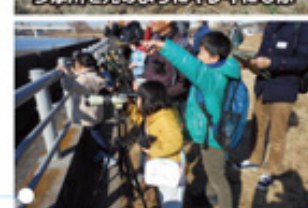
冬の生きもの調査会&野鳥観察会