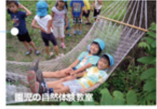
園児のカヌー体験教室