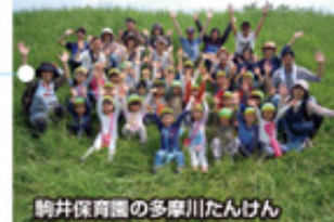
駒井保育園の多摩川たんけん