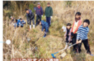
小川の泥すくい清掃