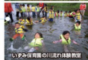
いずみ保育園の川流れ体験教室