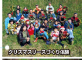
クリスマスリースづくり体験