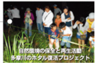
自然環境の保全と再生活動 多摩川のホタル復活プロジェクト