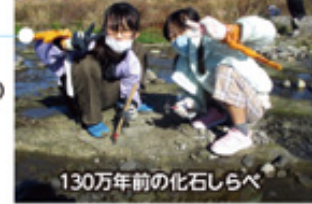
130万年前の化石しらべ

参加総数 2057名 ●主催行事/47回 1241名 ○支援事業/12回 816名