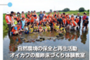
自然環境の保全と再生活動 オイカワの産卵床づくり体験教室