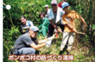
ボンボコ村の路づくり清掃