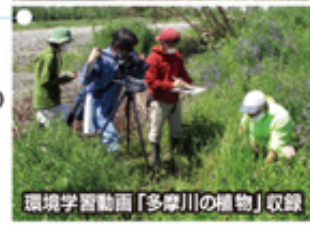
環境学習動画「多摩川の植物」収録