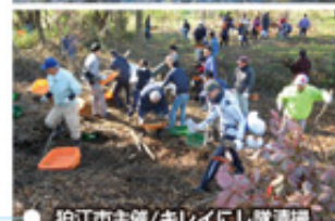
粕江市主催/キレイにし隊清掃