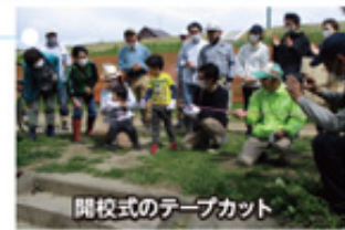
開校式のテープカット