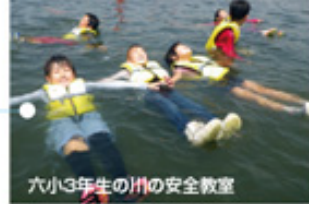
六小3年生の川の安全教室