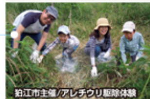
粕江市主催/アレチウリ駆除体験