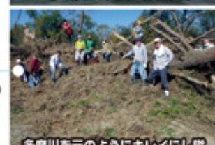
多摩川を元のようにキレイにし隊