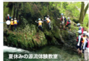
夏休みの源流体験教室