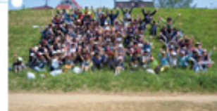
和泉小学校4年生の多摩川学習