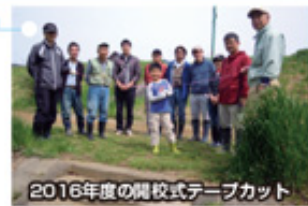
2016年度の開校式テニスコート