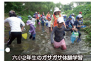
六小2年生のガサガサ体験学習