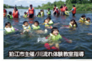
粕江市主催/川流れ体験教室指導