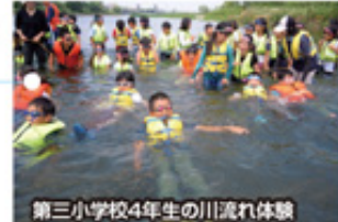
第三小学校4年生の川流れ体験