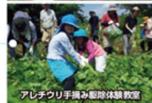
アレチウリ手摘み駆除体験教室