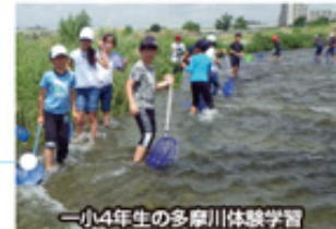
—小4年生の多摩川体験学習