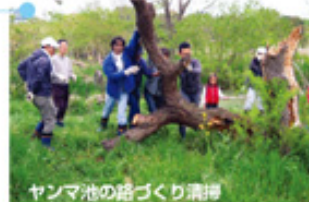
ヤンマ池の路づくり清掃