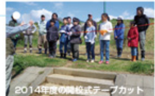
2014年度の開校式テープカット