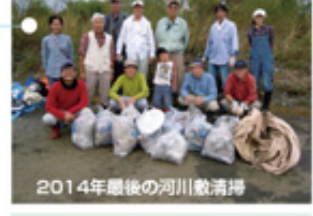
2014年最後の河川敷清掃