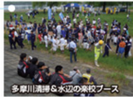
多摩川清掃&水辺の楽校ブース