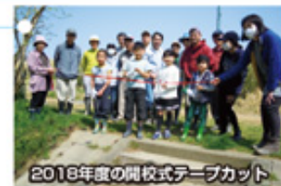
2018年度の開校式テープカット