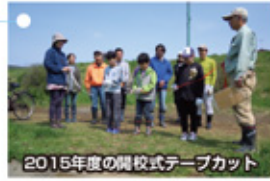
2015年度の開校式テープカット