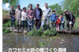
カワセミ水路の橋づくり清掃