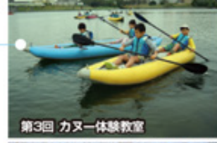
第3回 カヌー体験教室