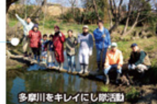
多摩川をキレイにし隊活動