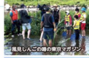
風見しんごの川の東京マガジン