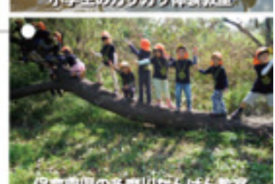
保育園児の多摩川たんけん教室