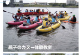
親子のカヌー体験教室