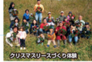
クリスマスリースづくり体験