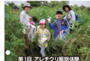
第1回 アレチウリ駆除体験