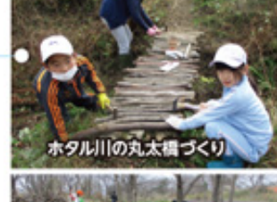
ホタル川の丸太橋づくり