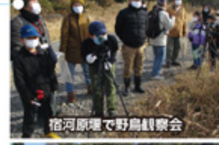
宿河原で野鳥観察会