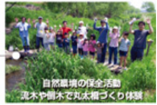
自然環境の保全活動 丸太や樹木で丸太橋づくり体験