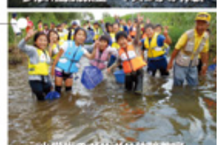
小学生のガサガサ体験教室