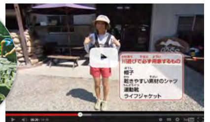
安全な川遊びのために 川での注意点等を映像で紹介しています。「子ども向け」(第1部)と「大人向け」(第2部)があり、第1部では川のお姉さんが初めての川遊びをレポートします。