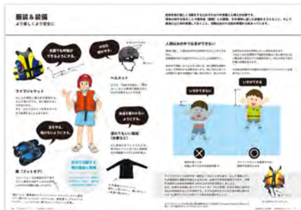
水辺の安全ハンドブック 川や水辺での活動をより安全で楽しいものとするためのポイントをまとめています。