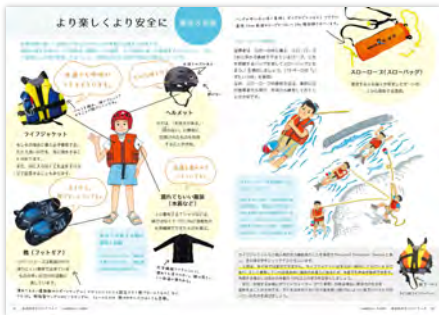
水辺の安全ハンドブック 川や水辺での活動をより安全で楽しいものとするためのポイントをまとめています。