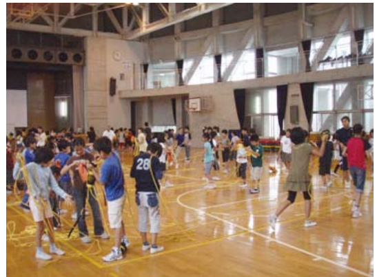
スローバッグ投げ体験

また、ライフジャケットの着用とスローロープ投げのこれまでにない体験に、子どもたちの真剣な取り組みに驚くとともに、担当教員からは眼からウロコと意見が出され、このような安全講座の必要性を強く感じました。