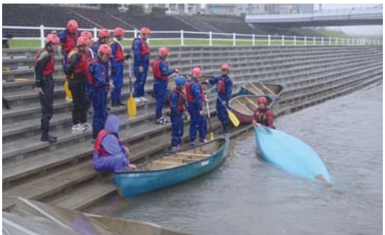
豊平川でのカヌー操船実習