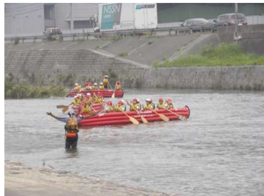
チームワークが必要なEボート体験