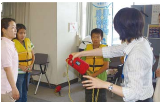
ライフジャケットの着用&amp;レスキュー体験