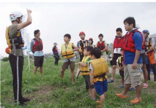
参加者へのセーフティトーク

期間は、7月1日～8月31日の2ヶ月間とし、全国のRAC加盟団体に呼びかけ、メインの活動日を7月5日(日)に決めました。RAC本部と子どもの水辺サポートセンターが連携して、多摩川の二子玉川で実施しました。当日は、少年サッカーの親子や「せたがや水辺の楽校」のイベントに参加した子どもたち延べ100人余りが、ライフジャケットを着用し、Eボート体験や多摩川の流りを体験しました。