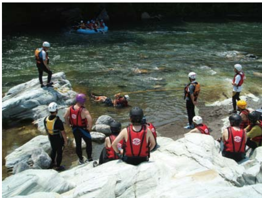
荒川長瀬でのRACリーダー養成講習会

これまで、各地域の河川管理者やその地域の市民団体や教育関係者等を対象とした指導者養成事業を数多く実施し、平成 14 年度から 21 年度まで財団主催のものだけでも 465 名の RAC 指導者を養成しています。