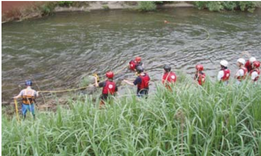
スローバットの体験実習