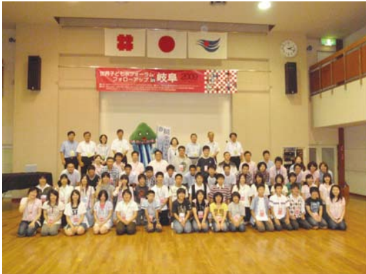
開会式の参加者全員の集合写真

この大会で学び、感じたことを地域での活動へ広げていき、今回出会った中高生および大学生におけるネットワークが構築されていくことを期待します。