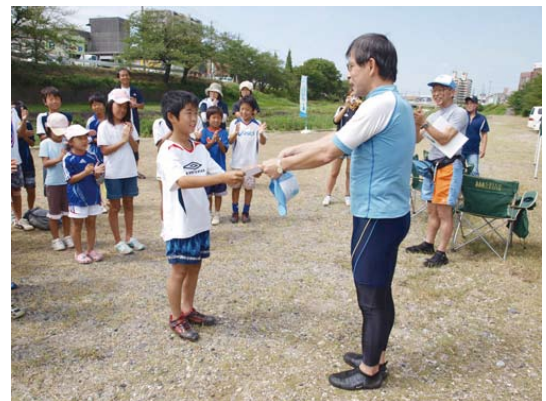
「水夢きっず賞」表彰式

この地元の川である瀬戸川で遊んだことがないという子どもたちが半数以上でしたが、「竹の水鉄砲」など保護者が子どもたちに行った遊びなどを通じて、地元の川や川遊びの楽しさを見直すきっかけになったようです。