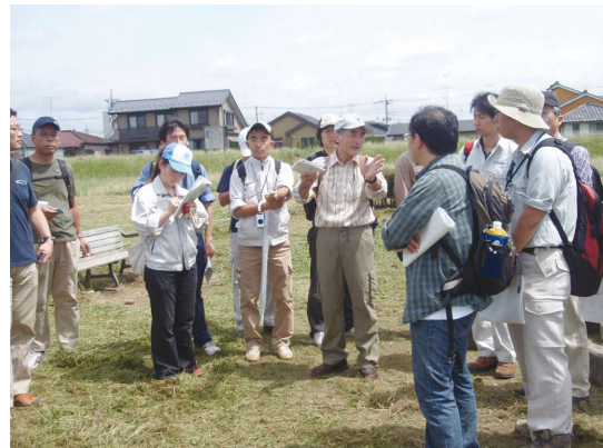
写真は高等科・初等科合同の多摩川現地調査 塾長による説明を聞く塾生

さらに、今年度は高等科（烏川・神流川編）を有志により設立し、初等科で習得した河道特性等に関する知見を復習し、理解を深めるために実河川を題材とし、演習形式での勉強会、現地調査等を行っています。