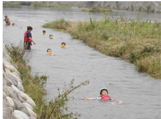
瀬野川の流りに身を任せ流れを体感

今回の調査研究は、2年前に体験活動を経験している6年生に注目しています。現在、調査結果の分析・評価については角屋研究室で進めています。