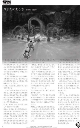
試行版の中の「やまたのおろち」