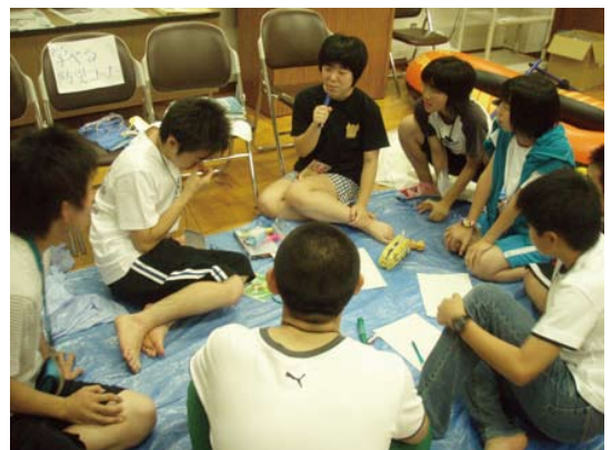
フォローアップ大会での分科会の様子

などの大きな成果が生れてきており、川や水に関する将来のオピニオンリーダーとして期待できる若者たちが育ってきているといえます。