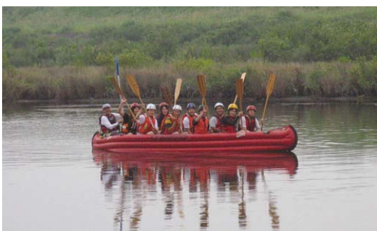
揖斐川でのEボート操船実習