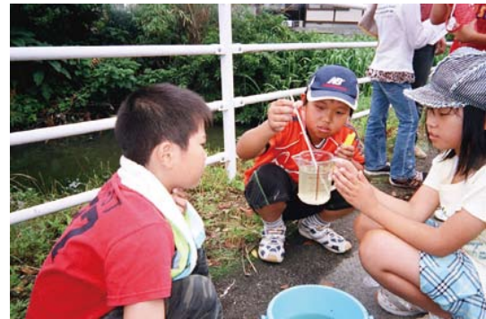
子どもたちも参加した一斉調査（佐賀県）

最終的な結果は、11 月末頃に「2009 第 6 回調査結果概要」として発表予定です。