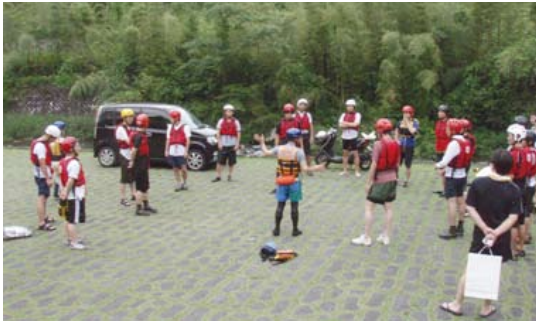
ライフジャケット着用とセーフティトーク