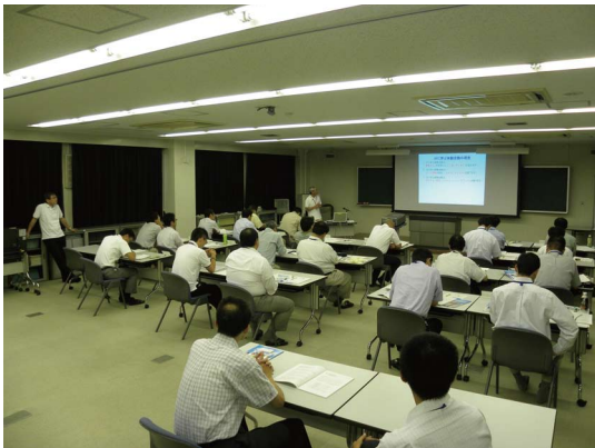
中部地整の職員研修と兼ねた講習会