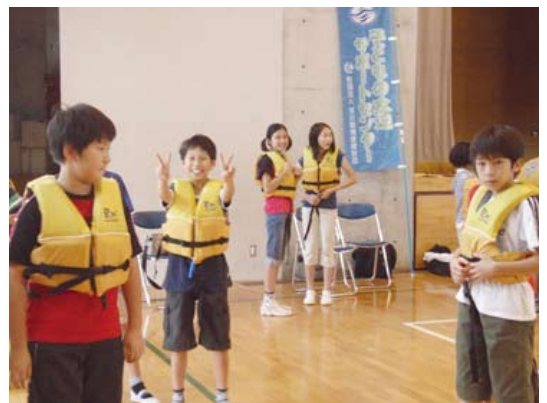
ライフジャケット着用体験