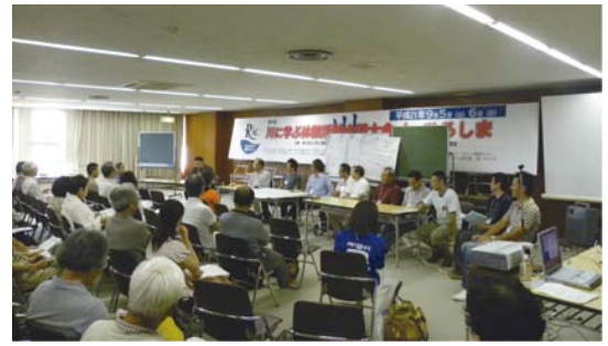
2日目（各分科会の報告）