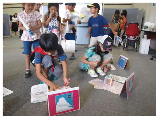
アクティビティ「驚異の旅」で水循環を学習