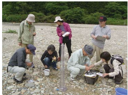
市民団体による一斉調査（宮城県）