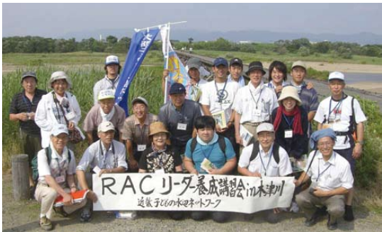
淀川水系木津川「上津屋橋（流れ橋）」での実習