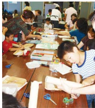
レインスティックづくり

会場では、プロジェクトWETのアクティビティの他、ライフジャケット着用やスローロープを使ったレスキュー体験ができるコーナーに多くの子どもたちが集まり、水や川のひみつを学んだり、水難事故防止方法等の学習をすることができました。また「雨の音」がする楽器「レインスティック」作成コーナーも大変盛況で、多くの子どもたちがオリジナルのレインスティックを工作・デコレーションし、夏休みの思い出として持ち帰ることができました。