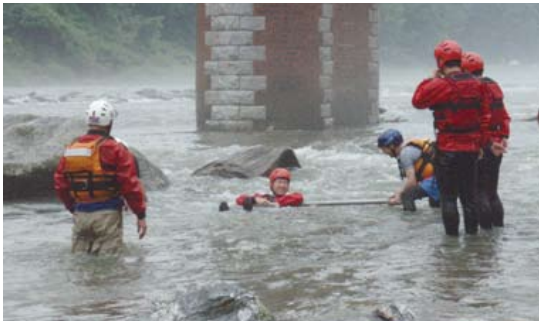
荒川・長瀬での動水圧体験

備局の河川環境研修をRACリーダー養成講習会と兼ねて実施し、国土交通省等の河川行政担当者13名も川の指導者（RACリーダー）となりました。