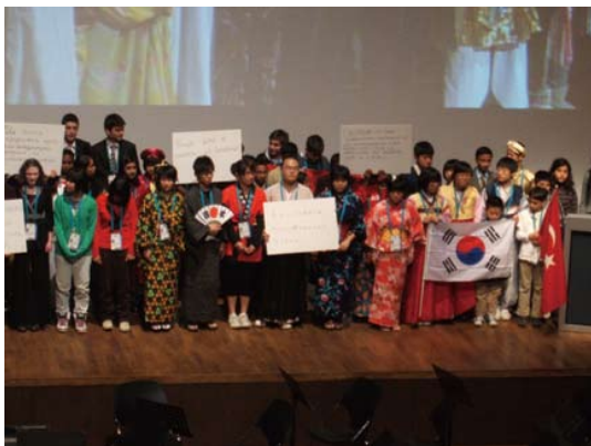
第3回世界子ども水フォーラム (トルコ・イスタンブール)