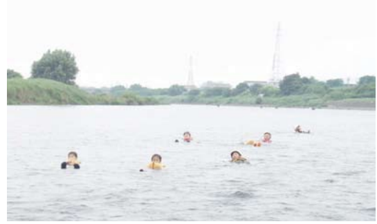
多摩川の流りに身を任せ