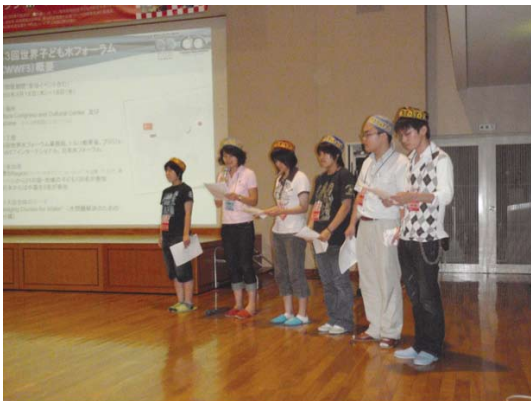
イスタンブール報告会