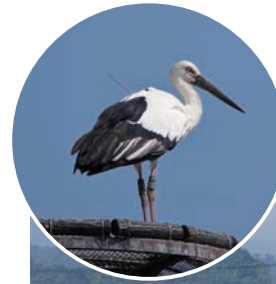
●六方田んぼに設置された人工の巣塔とコウノトリ。ここから計3羽のコウノトリが巣立った。