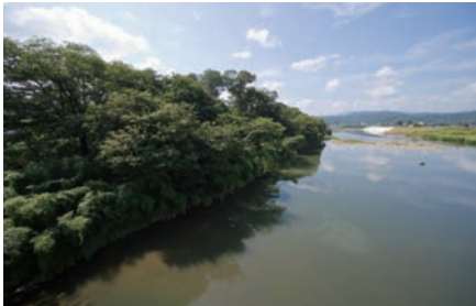
●円山川中流の上ノ郷地区の河畔林(上)と支川の六方川の植生(下)。円山川に特徴的なこうした自然環境は動植物の生息・生育の場として保全されている。