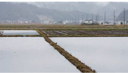
●冬期湛水の水田。カモやコハクチョウが飛来し、コウノトリがエサをついばみにやってくる。

人とコウノトリの共生できる環境と学習の場を提供することを目的として整備された約 165 ヘクタールの施設。コウノトリの人工飼育のほか野生化に向けての研究などがおこなわれ、公開ケージ内で飼育されているコウノトリと敷地内の湿地に集まるコウノトリが観察できる。