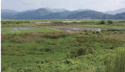
●出石川左岸の加陽地区では大規模湿地再生の計画が進む。