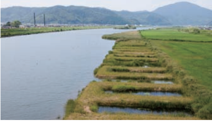
●円山川の高水敷に造成された試験湿地(上)。川とつながったワンドも生まれた(下)。