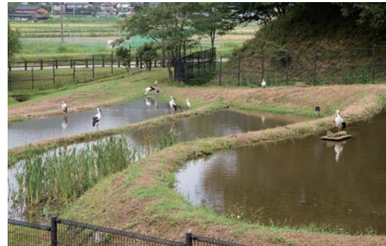
●人工飼育をおこなっているコウノトリの郷公園にある湿地。放鳥されたコウノトリもここへエサを食べにくることがある。

松島 ● わたしは円山川があるから、コウノトリは豊岡にすみついたと思っています。