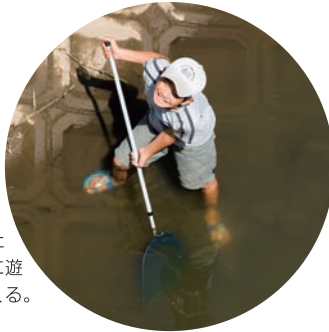
●六方川地域の子どもたちは六方川に遊びにやってくる。