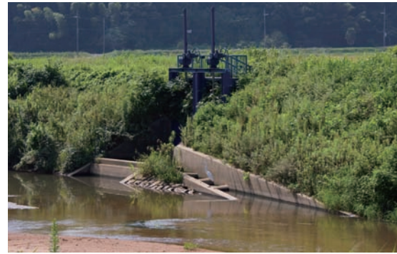
●六方川では兵庫県が樋門のわきに、階段式の魚道を設置したり(写真上・右)、前面にふとんカゴを設置する(写真下)ことで落差を解消した。その結果、六方川から六方田んぼにのぼってくる魚の種類、個体数ともに増加した。