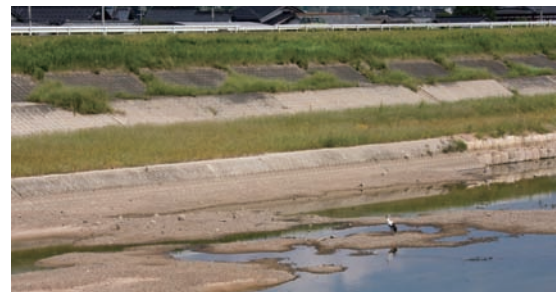
●出石川でエサを探すコウノトリ。

兵庫県立コウノトリの郷公園内にある施設。コウノトリやその野生復帰事業、さらに豊岡盆地の自然や文化について紹介している。