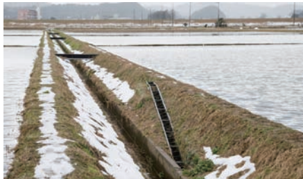
●水田と排水路のあいだに設置された水田魚道。こうした魚道に加え、川と水路の接続部分にも魚道がつけられることで川から水田まで魚が自由に行き来できるようになる。