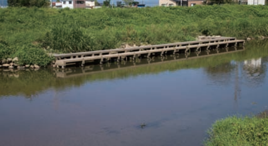
●木工沈床(もっこうちんしょう)をつかって河岸を整備した場所には観察木道が設置された。