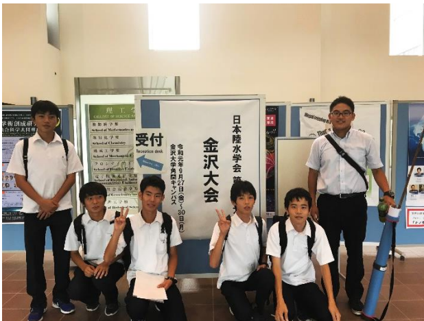
初めての学会発表

9月28日(土)に金沢大学で開催された日本陸水学会の高校生ポスター発表に、本校の2年生総合学習”土岐川ゼミ班”と科学部の”川研究班”が参加してきました。発表の内容は①自然共生研究センターの実験河川で行った「小さな自然再生」の結果及びその考察、②土岐川及びその支流の魚類相ついてです。生徒にとって、今回が初めての学会参加であり、発表に向けてテストの合間を縫い、ポスター・発表原稿の準備などを行ってきました。ポスター発表では、学会に参加している大学の教員・研究者等に対して自分たちの研究成果を堂々と発表することができました。今後の活動に対してのアドバイスをたくさんいただき、中には厳しい意見もありましたが、これぞ学会！という雰囲気を楽しむことができ、これからの活動に生かしていきたいと思えます。残念ながら、賞の受賞とはいきませんでした。学会に参加するという貴重な経験を積むことができました。学会終了後には、金沢大学の見学も行いました。