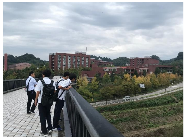
金沢大学の大きさに驚きました