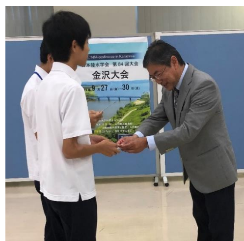
参加賞の金沢産の菓をいただきました